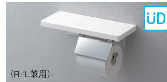
YH403FMR#NW1 棚付紙巻器(マットタイプ)

希望小売価格 ¥12,500 CAD 320×120×91.5 棚:木製 紙巻器:ステンレス製 紙切板:マット仕上げ(プラスト処理) 芯棒:鏡面仕上げ 立座ラック棚付 | 114mm以下 | 芯あり