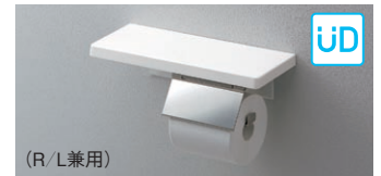
YH402FMR#NW1 棚付紙巻器(鏡面タイプ)

希望小売価格 ¥12,500 CAD 320×120×91.5 棚:木製 紙巻器:ステンレス製 紙切板:マット仕上げ(プラスト処理) 芯棒:鏡面仕上げ 立座ラック棚付 | 114mm以下 | 芯あり