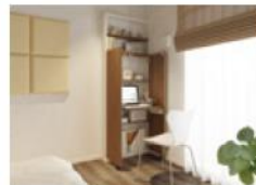
[収納] スイッチプラス740