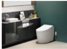
ネオレストシリーズ