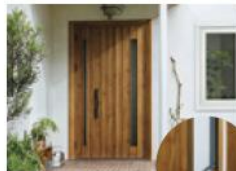
ドアリモ玄関ドアD30 (通風仕様)