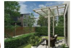
レセバ(独立式テラス屋根)