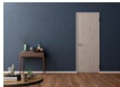
[建具] バピアノリッド調/リビングドア