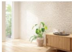
[壁材] グラビオエッジ