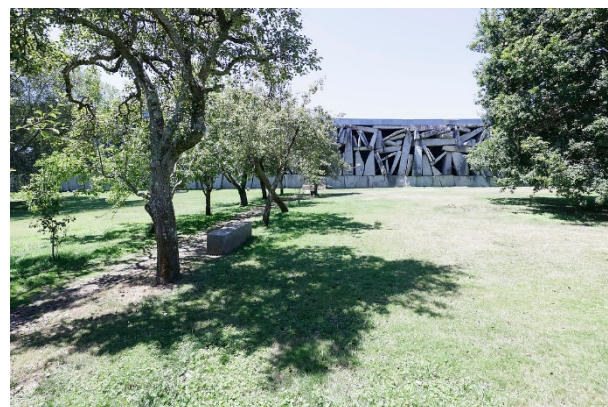
【1】ペトリファイド・リバー(石化した川)リサーチ(2017~)