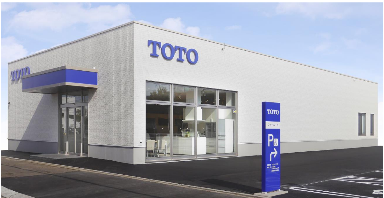
「TOTO帯広ショールーム」外観

※2: TOTOがおすすめする「あんしん」の増改築工事会社ネットワーク加盟店です。リモデルプランの提案や施工からアフターサービスまで総合的にお手伝いします。