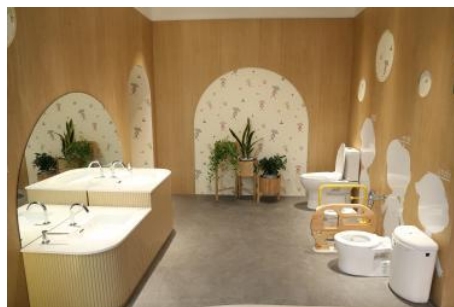
キッズトイレ向け商品展示