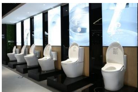
「ウォシュレット」展示コーナー

レストルーム商品、水栓金具、浴室商品を多数展示しています。ウォシュレット一体形便器「ネオレスト」や「ウォシュレット」は通水・通電を行い、洗面器と浴槽は水栓との組み合わせ検討が可能です。