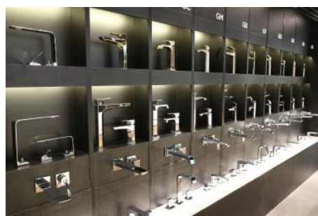
水栓金具バリエーション展示