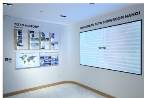
企業紹介コーナー