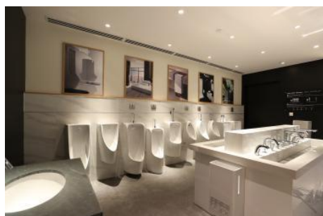
小便器、水栓、洗面器展示

デザイナーや設計士など建築の専門家の方へホテルや商業施設向けの商品を展示しています。