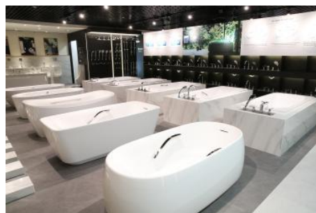
浴槽バリエーション展示