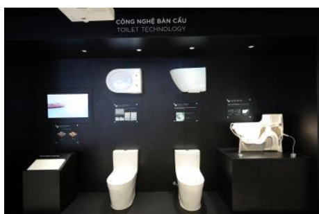
大便器の節水・洗浄機能展示

大便器の節水・洗浄機能、ウォシュレットの吐水方法、非接触商品(自動水栓など)の特長やTOTOの独自技術について、通水・通電による体感型の展示で紹介しています