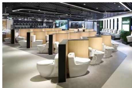
大便器+「ウォシュレット」組み合わせ展示コーナー