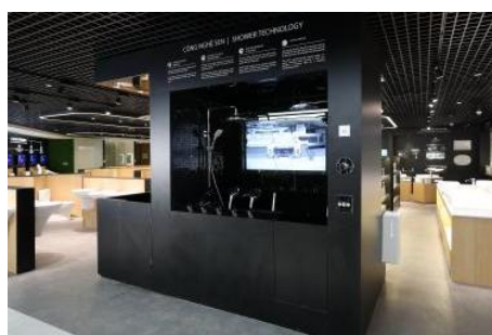
シャワーの技術展示