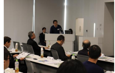
過去の「助成先団体交流会」の様子

また、助成先団体のネットワークづくりや活動のステップアップ支援を目的として、「助成先団体交流会」を開催しています。こうした活動は、TOTOグループ社員の社会貢献・地域共生に対する意識の醸成と社会貢献活動へ参画する“きっかけ”となっており、このプログラムを通じた地域とのコンタクトの積み重ねが、TOTOグループと地域社会との共生につながると考えています。