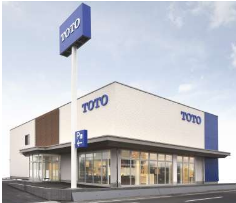
「TOTO鹿児島ショールーム」外観写真

※2:TOTOがおすすめる「あんしん」の増改築工事会社ネットワーク加盟店です。リモデルプランの提案や施工からアフターサービスまで総合的にお手伝いします。