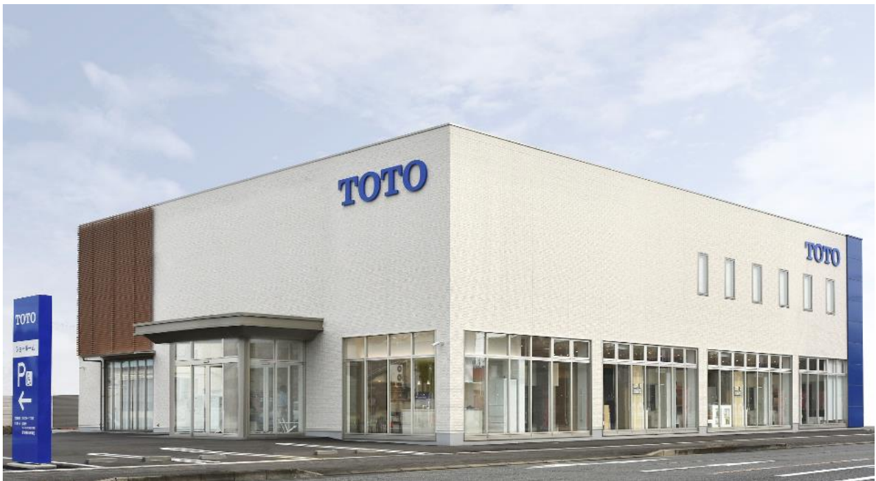
「TOTO高崎ショールーム」外観写真

※1:リモデルプランの提案や施工からアフターサービスまで総合的にお手伝いする、日本最大級の増改築工事会社ネットワークです。