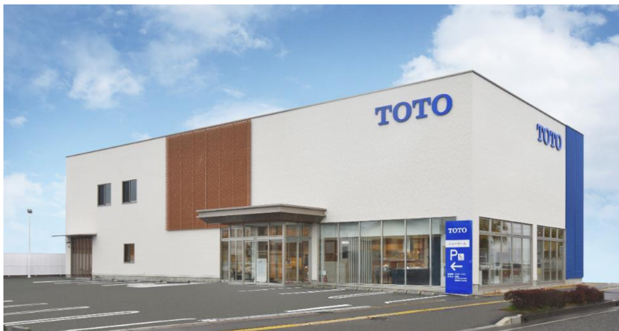
「TOTO宮崎ショールーム」外観写真

※1:リモデルプランの提案や施工からアフターサービスまで総合的にお手伝いする、日本最大級の増改築工事会社ネットワークです。