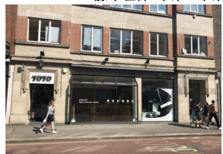
TOTOロンドン ショールーム外観