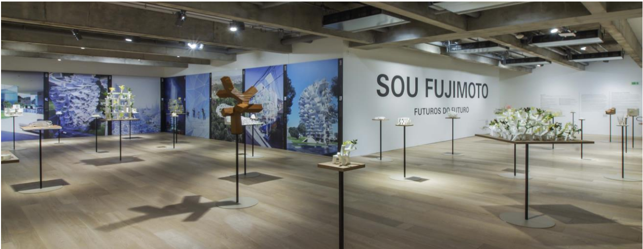
2017年11月～2018年3月サンパウロ展

TOTOギャラリー・間では、今後も建築とデザインの専門ギャラリーとして情報を発信し、国内外の文化向上に貢献していきます。