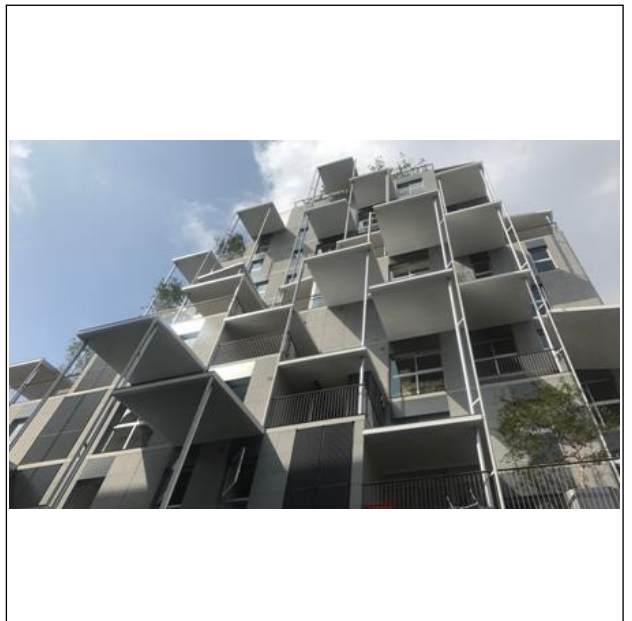
[4] Taipei Roofs (台湾、台北市、2017年) ©akihisa hirata architecture office