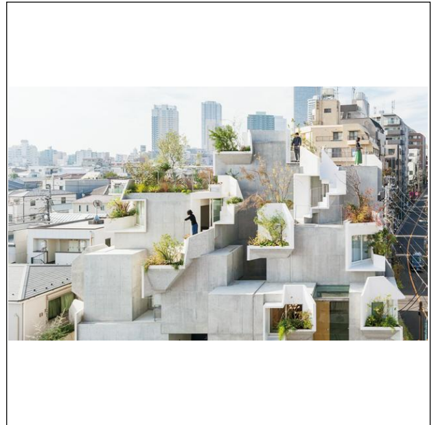
[2] Tree-ness House (東京都、2017年)