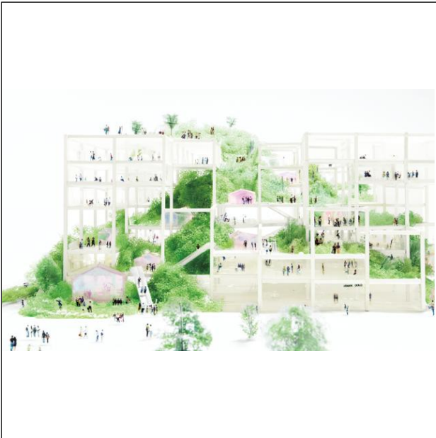
[1] Taipei Complex (台湾、台北市、進行中) ©Yukikazu Ito