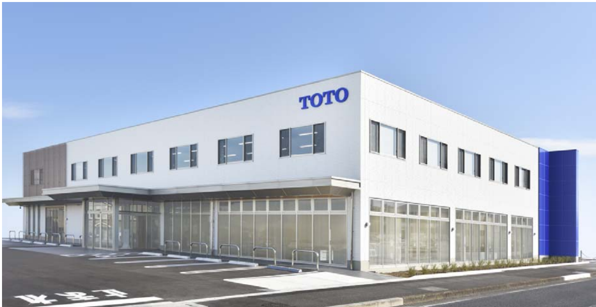
「TOTO大宮ショールーム」外観イメージ

TOTO 大宮ショールームでは、引き続き、埼玉県内のお客様の暮らしを快適にする水まわり商品をご提案してまいります。