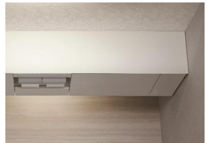
クリスタルカウンター〈クリスタルスノー〉

御影石を思わせる重厚感のある質感、白く輝くカラーリングにより、上質で清潔感のある空間を演出