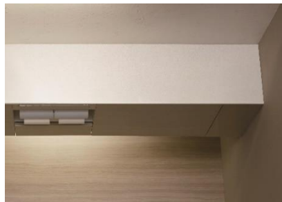
グラニトホホワイトストーン

透明感のある素材に、山のふもとにたゆたう霞を表現した繊細な柄を組み合わせ、空間を個性豊かに演出