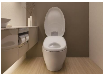
人が近づくと、便ふたが開く