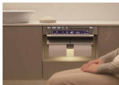
着座すると、ビルトインリモコンが開く