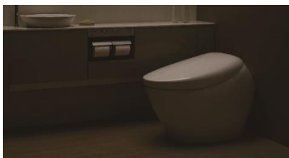
入室前、消灯した状態

人の入退室や着座などの動作にあわせて、照明とビルトインリモコン、便器の便ふたが自動できめ細かく作動します。快適な使い心地をもたらします。