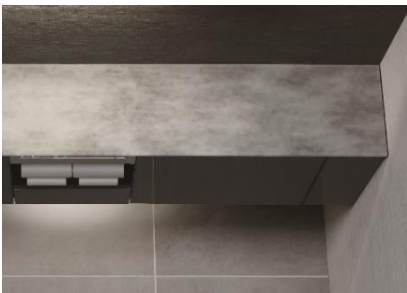
クリスタルカウンター〈霞(かすみ)〉

透明感のある素材に、山のふもとにたゆたう霞を表現した繊細な柄を組み合わせ、空間を個性豊かに演出