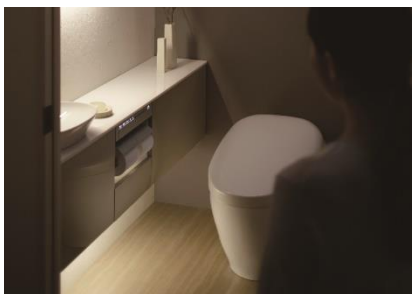
入室を検知し、照明とビルトインリモコンが点灯

人の入退室や着座などの動作にあわせて、照明とビルトインリモコン、便器の便ふたが自動できめ細かく作動します。快適な使い心地をもたらします。