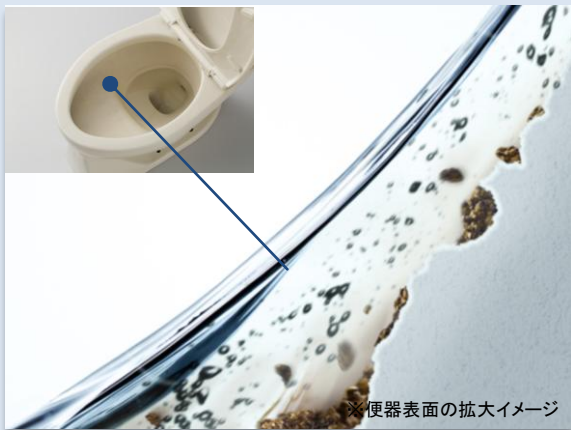
従来便器 表面に凹凸があり、汚れがたまりやすかった (1998年以前の商品)