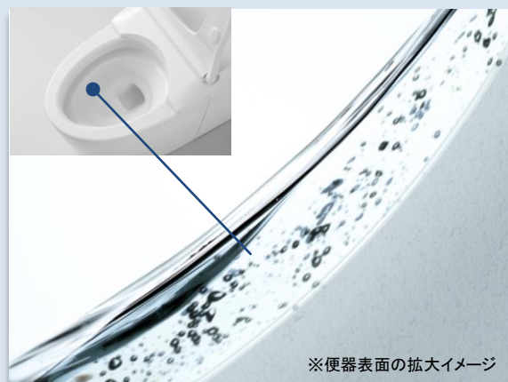
セフィオンテクト 表面がなめらかなので、汚れが付きにくく落ちやすい ※便器表面の拡大イメージ