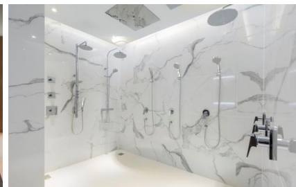
【上:テクニカルセンター入口、下左:テクノロジーゾーン、下中央:バスタブゾーン、下右:エクスペリエンスルーム】

上記写真・イラストの高解像度データは、下記 URL よりダウンロードいただけます。