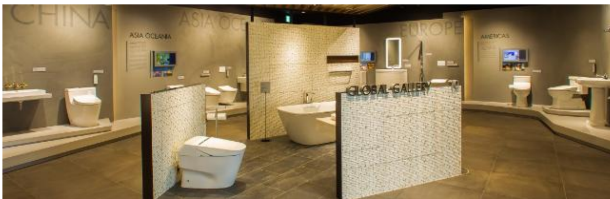
「グローバルギャラリー」展示の様子

TOTOは、1917年の創立時から海外市場を視野に入れ、社名を「東洋陶器株式会社」としました。現在では活動の場を世界に広げ、それぞれの国や地域に根ざした企業として取り組んでいます。その取り組みの歴史や海外展開している商品については「グローバルギャラリー」でご紹介しています。日本の皆さまに、そして日本を訪れる外国の方にも、国内での活動とともに海外でのTOTOの取り組みの歴史と「これからのTOTO」をご覧いただけます。