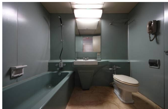
初代ユニットバスルームの展示