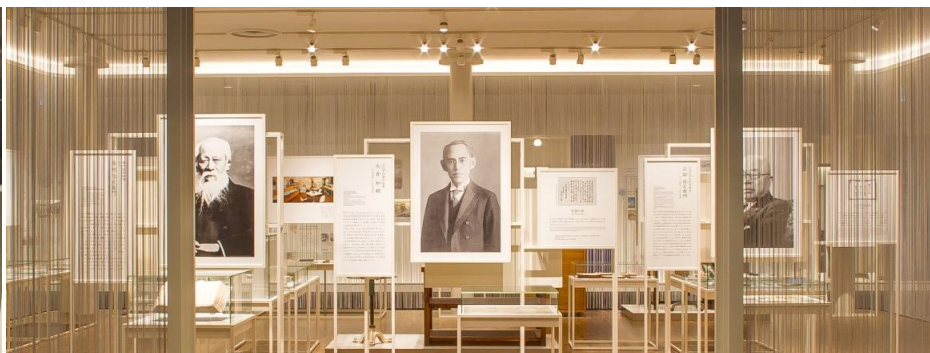
「TOTOのころざし」展示室の様子