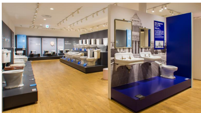
「水まわり商品の進化」展示室の様子

TOTOミュージアムでは過去に納入した著名現場を再現して展示しています。展示「水まわり商品の進化」では、東京オリンピック(1964年)の際にホテルニューオータニへ納入した初代ユニットバスルームをはじめ、霞が関ビルディング(初代ユニットトイレ)、迎賓館赤坂離宮(大便器・ビデ・浴槽)等を展示しています。空間ごとに再現することで当時の様子をリアルに感じていただけます。