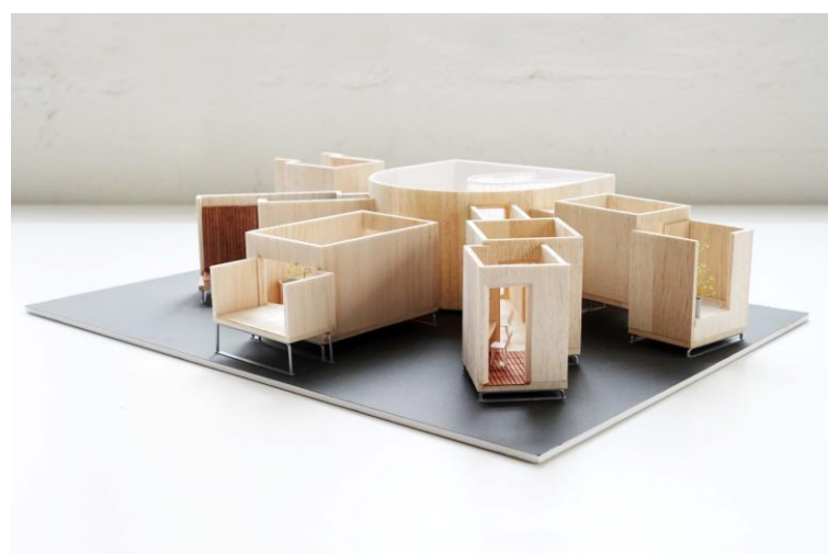
【TOTO・YKK AP エキシビジョンハウスのイメージ】

『HOUSE VISION』 公式サイト http://house-vision.jp/