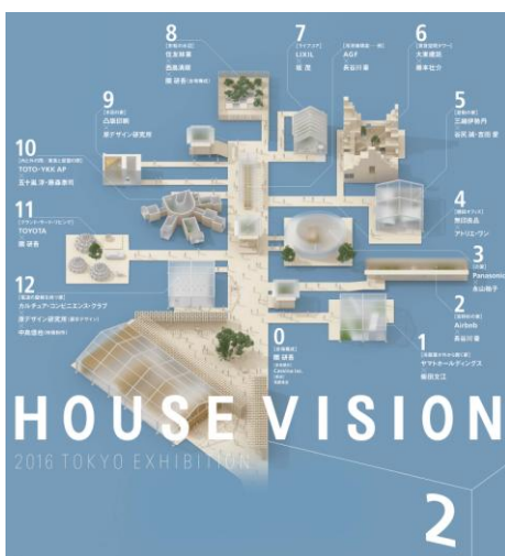
【HOUSE VISION 2016】

※TOTO・YKKAPが2013年に出品した「極上の間」は、「日常を忘れた時間を過ごせるひとりのための空間」をコンセプトに室内の壁面を360度緑で覆い、そこに窓とトイレと洗面器を配置し、透明で広がりのある清浄な空間としました。