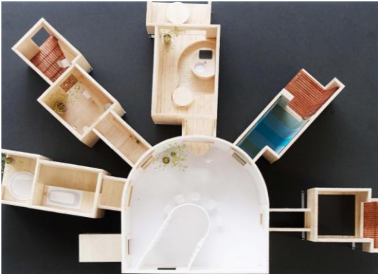
TOTO・YKK APエキシビジョンハウスの断面 部屋の開いた窓から次の空間へ入れます