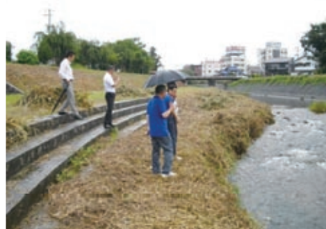
「水遊びのできる河川敷にしたい」とメンバー