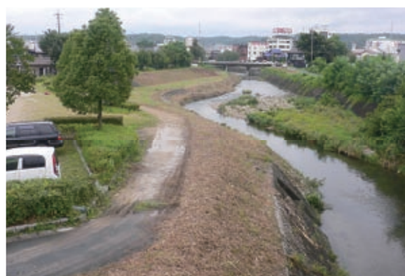
親水公園とは名ばかりで、川幅は狭く水深も深くなっている