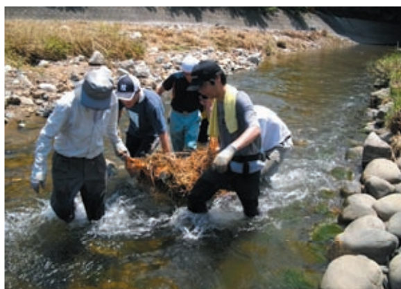
緊急に集まったボランティアが大雨による被害を復旧させた