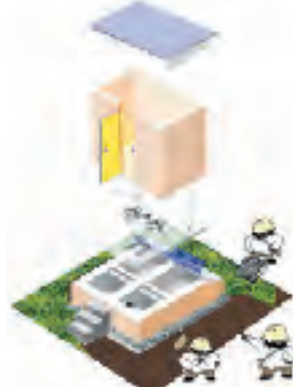
し尿を分離し排泄物を活用するエコサン・トイレ