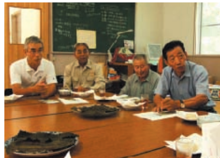
こちらの質問に逐一、熱く説明される会員の皆さん