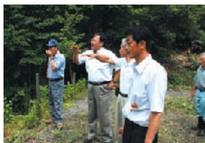
森林を一望できる展望広場も作る予定だ