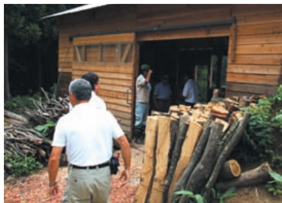
すでにメンバーで立派な炭焼き小屋と炭窯が作られている