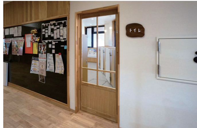
園児用トイレ 入口

道路を挟んで2つに分かれていた旧園舎を1つに集約。家庭のような温かいこども園を目指し、大きな家のような存在となるよう、外壁の一部にはガルバリウム鋼板の横葺きという手仕事を施すなど、優しい印象に仕上げている。