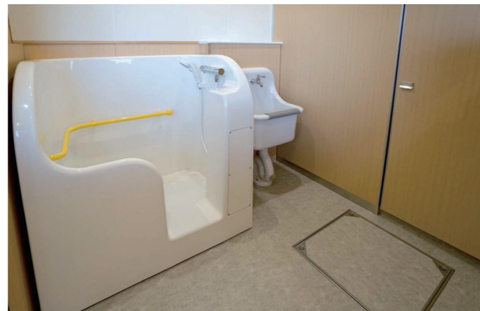
幼児用シャワーパン・SK

大便器は、園児の成長に伴いプライバシーに配慮して個別ブースを採用し、3-5歳児用の幼児用大便器を設置。またブースの扉や壁は、職員が上から見守れる高さに設定している。